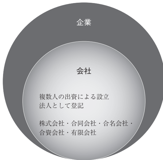
図表 1-1 企業と会社の関係性 筆者作成

つまり、「企業」は2通りの意味をもち、事業体として「会社」の上位概念にあたり、法律によって規定され法人格をもつことで「会社」となるというわけです（図表 1-1）。法律で定められていて、一般的に公式の社名にも、例え